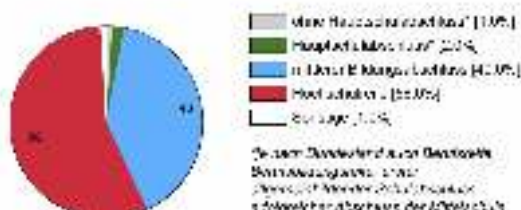
Ausbildungsabweichung (in %)