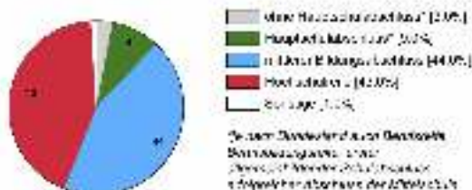
Ausbildungsabweichung (in %)