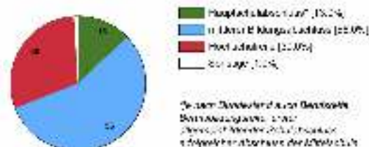
Ausbildungsabweichung (in %)